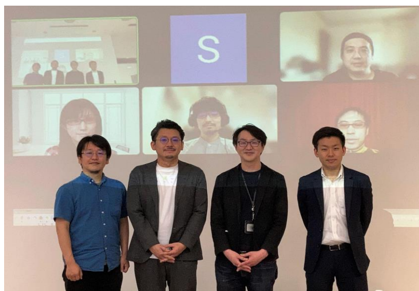
サブスク開発アライアンス体制主要メンバー